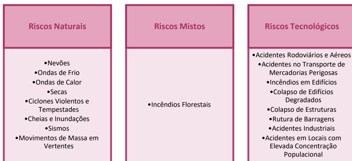
Figura 1. Riscos naturais, mistos e tecnológicos do concelho de Seia

Entre os riscos passíveis de ocorrer e afetar o território do concelho de Seia alguns destacam-se pela sua particular incidência e/ou potencial gravidade das suas consequências. O Quadro 1 faz uma breve apresentação hierárquica desses riscos, tendo em conta a sua particular incidência e/ou pela potencial gravidade das suas consequências.